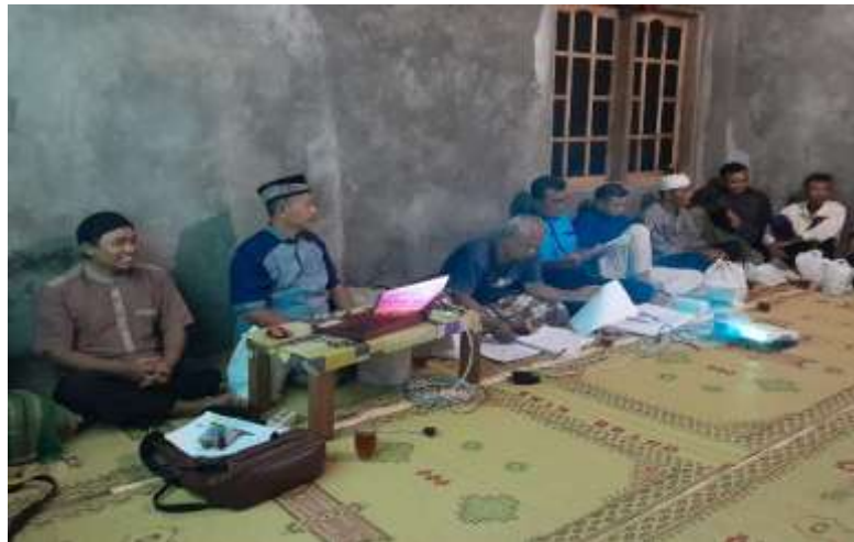
Gambar 1. Sambutan Pengurus RT 15 dusun salam kelurahan patuk

kemudian dibuka oleh bpk RT 15 dengan memberikan gambaran tentang kegiatan yang dilakukan dan manfaat yang diharapkan setelah mendapatkan informasi tentang penggunaan aplikasi Microsoft Powerpoint .