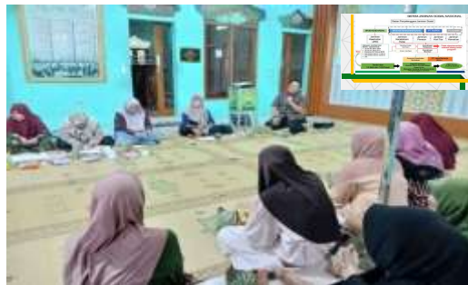
Gambar 1. Pemberian Materi oleh Narasumber melalui Sosialisasi Skema Penjaminan Kesehatan Dalam Program JKN

Kegiatan pengabdian kepada masyarakat menghadirkan narasumber dari dosen STIKes Surya Global Yogyakarta. Narasumber yang dihadirkan pada kegiatan ini merupakan praktisi, pakar dan para ahli di bidang pengelolaan jaminan kesehatan. Narasumber menyampaikan materi dan menayangkan dalam bentuk power point . Pelaksanaan sosialisasi berlangsung selama 1 hari yaitu hari Rabu tanggal 19 November 2025. Pelaksanaan kegiatan ini berlangsung terkendali dan lancar seperti ditunjukkan pada gambar 1.