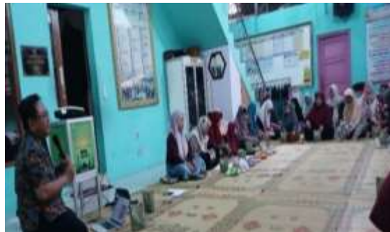
Gambar 3. Partisipasi Masyarakat dalam Kegiatan Sosialisasi

Evaluasi terhadap minat masyarakat untuk bersedia mengikuti sosialisasi dengan baik terlihat banyaknya peserta yang bertanya mengenai topik yang disampaikan mulai dari alur prosedur penggunaan jaminan kesehatan yang ada di negara Indonesia dapat ditunjukkan pada Gambar 3.